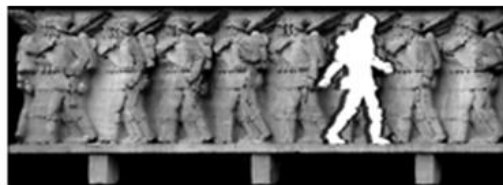
Hamburger Bündnis für ein Deserteursdenkmal